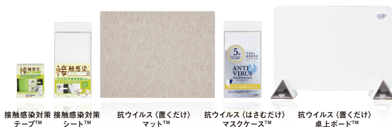
接触感染対策テープ™ 接触感染対策シート™ 抗ウイルス(置くだけ)マット™ 抗ウイルス(はさむだけ)マスクケース™ 抗ウイルス(置くだけ)卓上ボード™