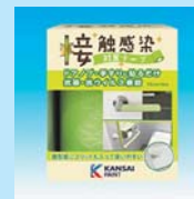
接触感染対策テープ