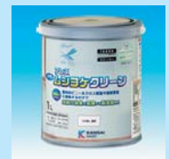
アレスムシヨケクリーン