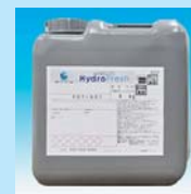
ハイドロフレッシュ