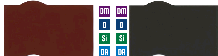
ロイヤルレッド ビスタブラウン