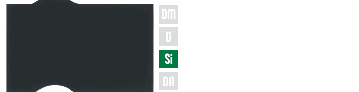
ジェットブラック モルトブラウン