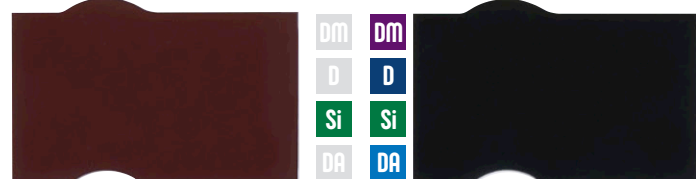
マルーン ネオブラック