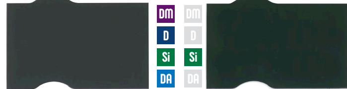
カーボングレー モスグリーン