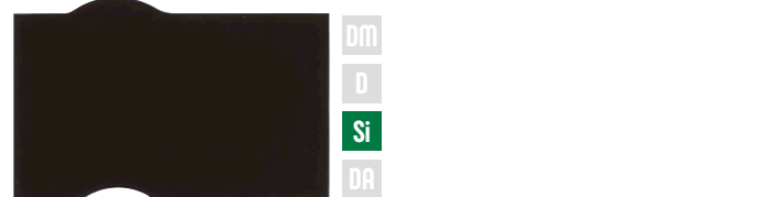
チャコールブルー ホワイト