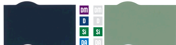
ナスコン ミストグリーン