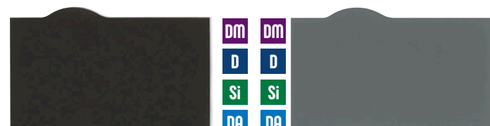
セピア スチールグレー