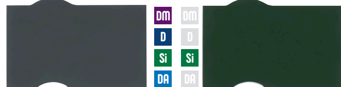
グラニットグレー フレッシュグリーン