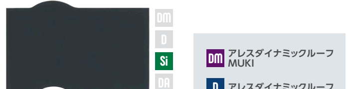
ミッドナイトブルー