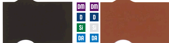
コーヒーブラウン ガーネットオレンジ