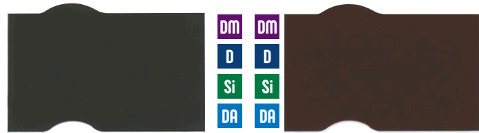
新ブラウン チョコレート

様々なイメージの演出に対応することができるカラーバリエーションがより一層増えて選ぶのが楽しくなりました。