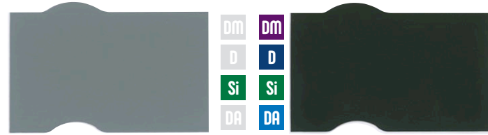
グレー ネオモスグリーン