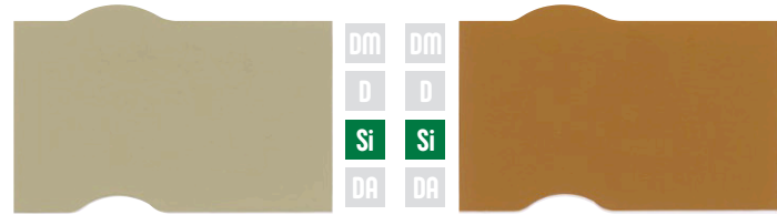
クリーム イエローオーカー